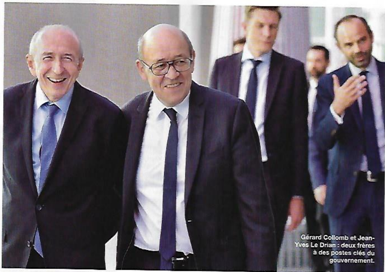
Gérard Collomb et Jean-Yves Le Drian : deux frères à des postes clés du gouvernement.