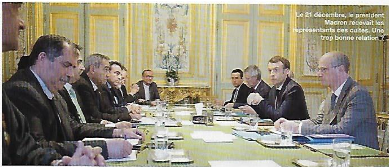
Le 21 décembre, le président Macron recevait les représentants des cultes. Une trop bonne relation ?