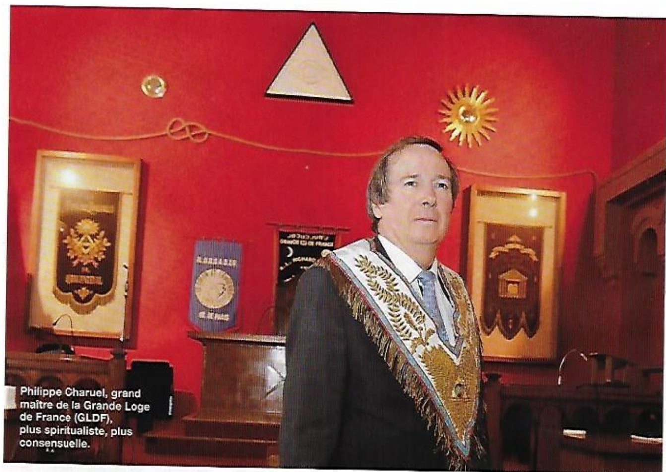
Philippe Charuel, grand maître de la Grande Loge de France (GLDF), plus spiritualiste, plus consensuelle.