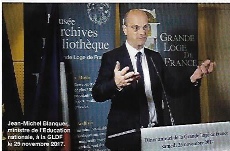
Jean-Michel Blanquer, ministre de l'Éducation nationale, à la GLDF le 25 novembre 2017.